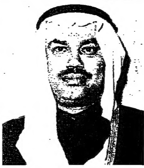
السيد عبد المطلب الكاظمي وزير النفط الكويتي

السيد عبد المطلب الكاظمي وزير النفط الكويتي، في مؤتمر صحفي، ان يكون لقرار الكويت الخاص بانهاء امتياز شركة الزيت الاميركية المستقلة «ايمين اول» اي تسير سياسي في العلاقة بين الكويت والولايات المتحدة. وقال: لقد تمنا بعمل السيادة الوطنية لضمان حقوق الكويت كما ان تاملنا في السليق مع شركة وليس مع دولة. وقد اشار الكاظمي في هذا المؤتمر الى الصعوبات التي واجهتها الكويت مع شركة «ايمين اول» وقال: ان قرار اجتاع ابو ظبي السابق من هذا الصدد ينص على رفع نسبة الارباح الى ٨٥ بالمائة ونسبة الضرائب الى ٢٠ بالمائة ولكن الشركة لم تستطع تطبيق القرار كما نفي ما تردد حول خسائر الشركة وقال: انها على المكس من ذلك ولديها ارباح مزاكية. وكذا وزير النفط الكويتي مقدر الصفاة الكويتية على تسير اعمال الشركة الجديدة التي انشأتها الكويت، وهي شركة «الوفرة الكويتية» لتتولى اعمال الشركة الاميركية. الا ان الكاظمي لم يستبعد استخدام خبرات عربية واجنبية من الخارج للاستفادة بها في عمل الشركة الجديدة.